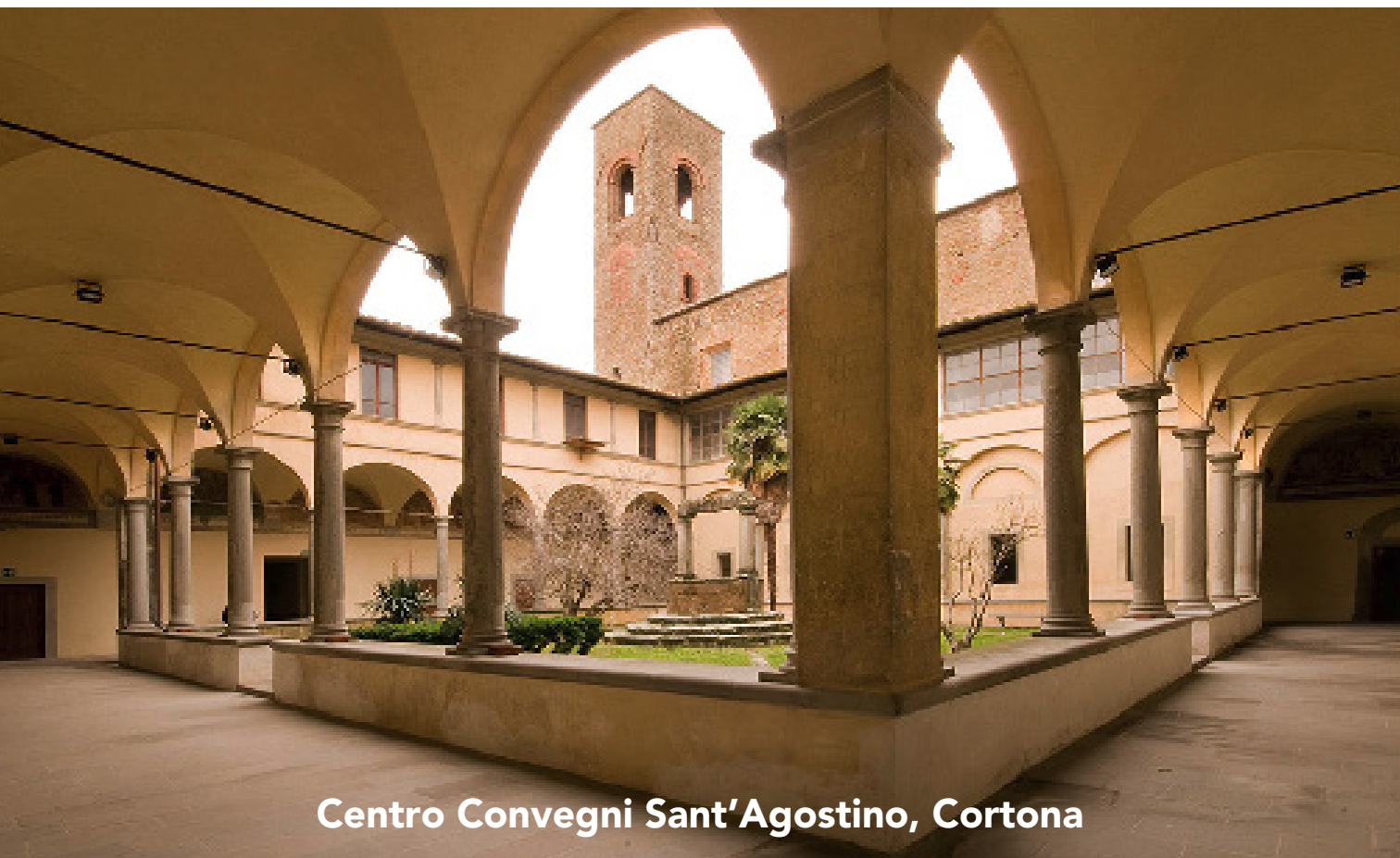
Centro Convegni Sant'Agostino, Cortona

L'assegnazione dei crediti formativi E.C.M. è subordinata alla presenza effettiva al 90% delle ore formative, alla corretta compilazione della modulistica e alla verifica di apprendimento mediante questionario online con almeno il 75% delle risposte corrette. L'attestato riportante il numero dei crediti sarà rilasciato solo dopo aver effettuato tali verifiche.